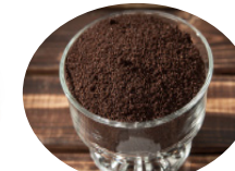
marc de café